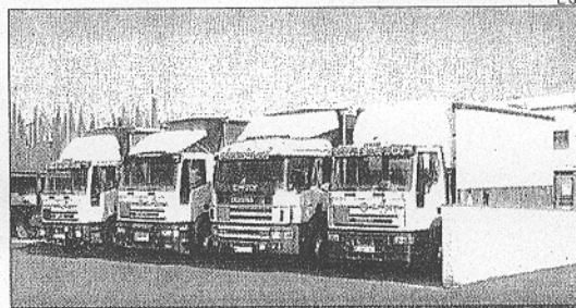
Azor Ambiental dispone de una flota de 14 automóviles