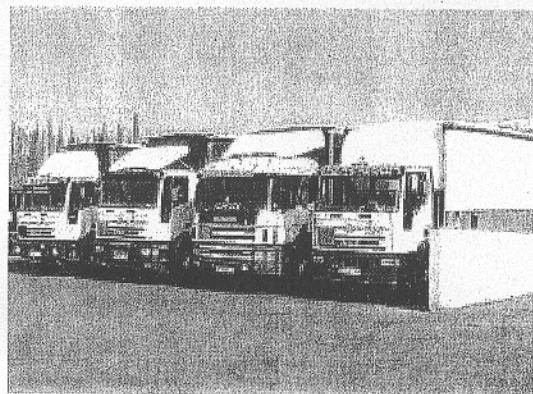
FLOTA. Los camiones se adaptan a las condiciones del transporte.