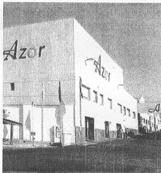
FACHADA. Exterior de la empresa Azor Ambiental.

Vinculados a la labor de Azor se encuentran los talleres. Ellos son el